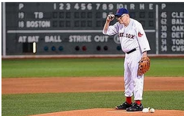
วอร์เรน บัฟเฟตต์ (Warren Edward Buffet)